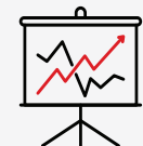
基础资产的市场 波幅

根据一般规律，如果利率下降，市场联动定期存款的期中账单价值就可能会提高。或者，如果利率上升，市场联动定期存款的期中账单价值就可能会降低。这些变动会对定期存款估值会造成多大影响，取决于距离到期日的剩余时间